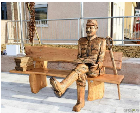
Vir 4: https://www.prlekija-on.net/lokalno/29480/marko-po-narocilu-obcine-izdelal-klop-s-skulpturo-generalamaistra.html